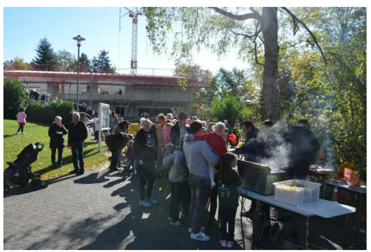
Neben Bratwurst gab es zu diesem Fest Pommes Frites

Und noch ein paar Impressionen der Feier: