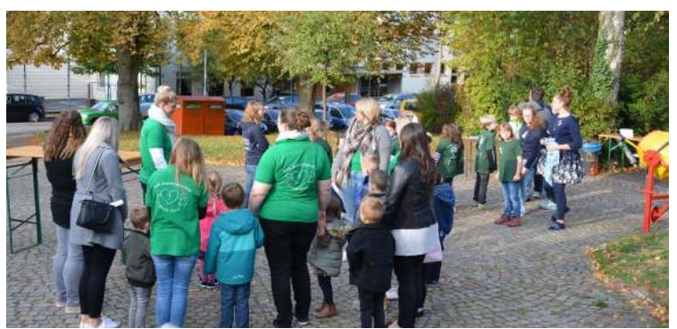
Die Kinder des Kindergartens und die neuen Erstkommunionkinder warten vor der Kirche auf den Einzug.