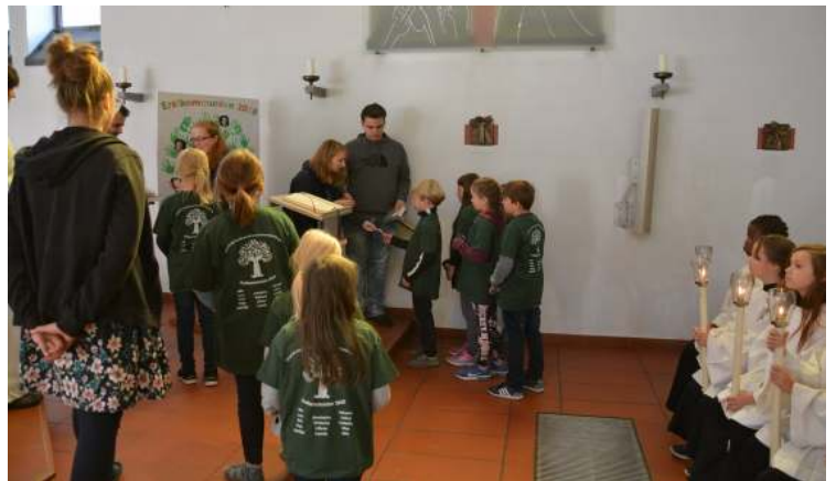
Danach bringen die neuen Erstkommunionkinder ihre Fotos nach vorn, wo sie für die Gemeinde sichtbar auf einem Plakat angebracht werden