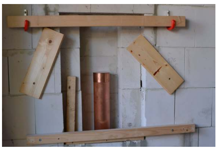
Die Kartusche wird erst in die Wand eingesetzt, davor dann die Grundsteine.