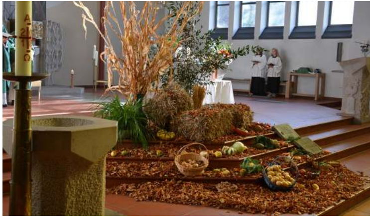
Der festlich geschmückte Altarraum zum Erntedankfest und mit dem neuen Grundstein sowie dem Grundstein der Marienhöhe