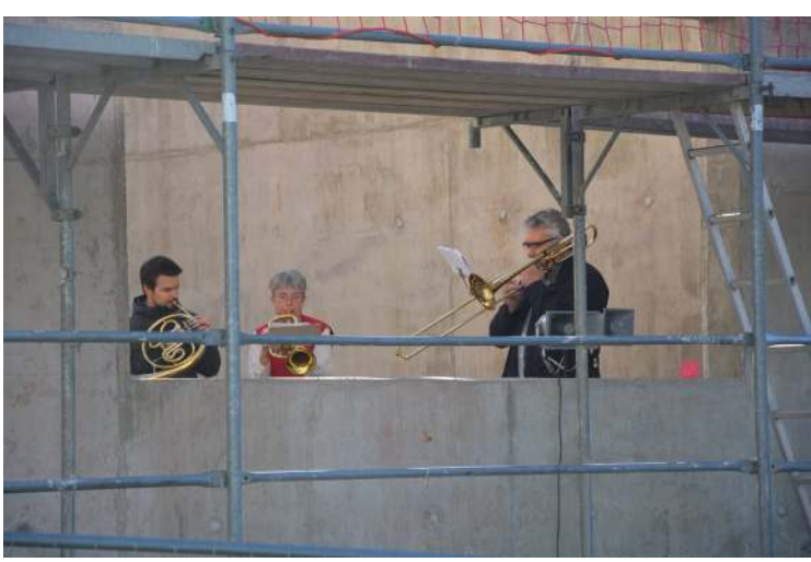
Der Posaunenchor der evangelischen Bartholomäusgemeinde, spielte nicht nur im Gottesdienst, sondern auch zum Richtfest.