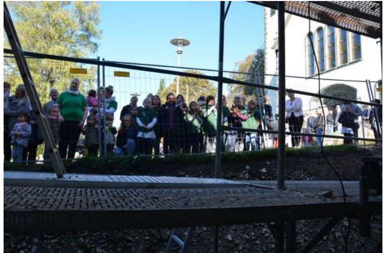
Vom Kirchplatz aus konnte die Gemeinde zuschauen