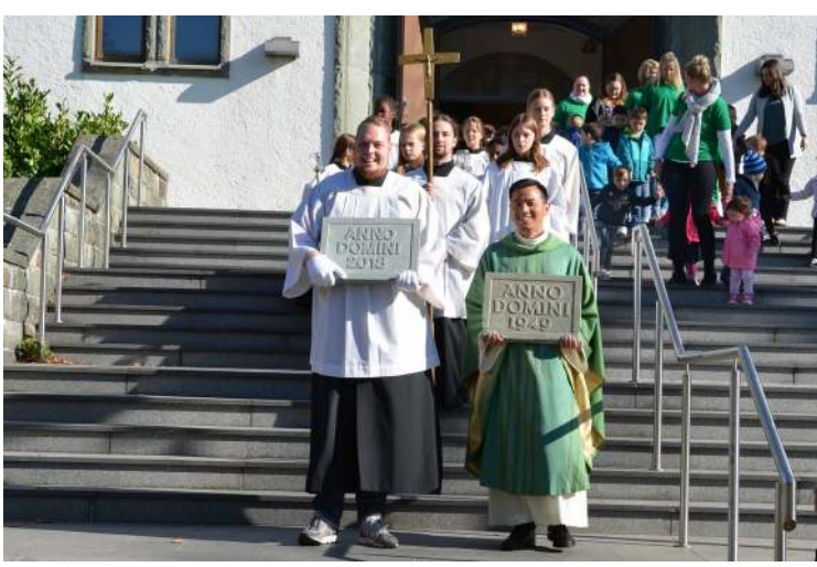
In feierlicher Prozession werden die Grundsteine zum Pfarrheim gebracht