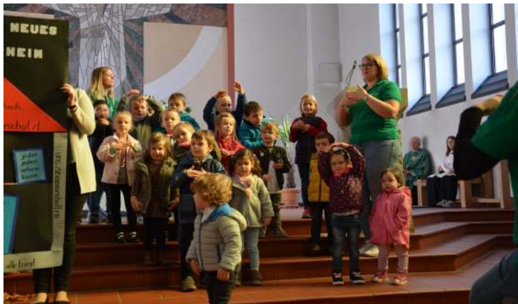
Die Kinder der Kita Herz-Jesu bauen in ihrem Singspiel auch ein Pfarrheim für die Gemeinde